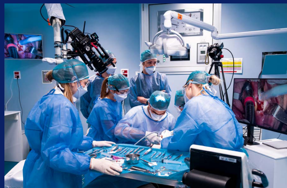
Intervento in live surgery con 4 telecamere in sala operatoria