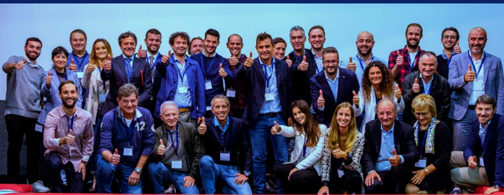
Partecipanti e organizzatori dell'edizione 2022