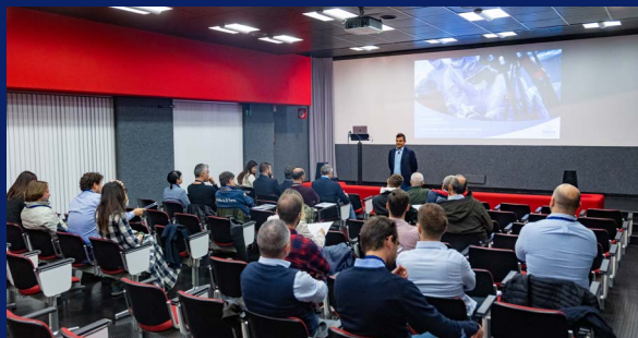
Auditorium sede del corso durante la proiezione di una live surgery