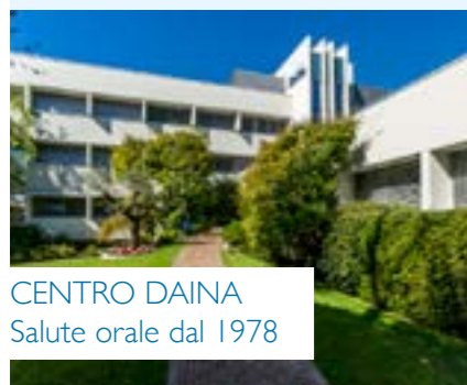
CENTRO DAINA Salute orale dal 1978