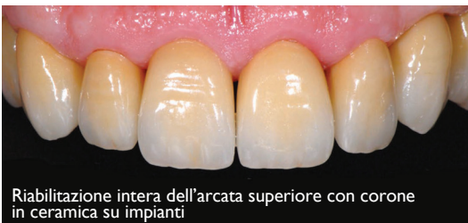
Riabilitazione intera dell'arcata superiore con corone in ceramica su impianti

In ogni caso tempi d'attesa diversi per un medesimo risultato: denti fissi e... un nuovo sorriso!!