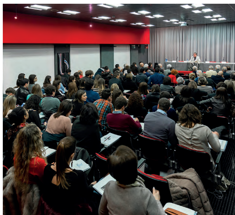
Auditorium del Centro Daina.

L'inaugurazione del Parco avverrà a fine settembre con altre sorprese tutte da scoprire.