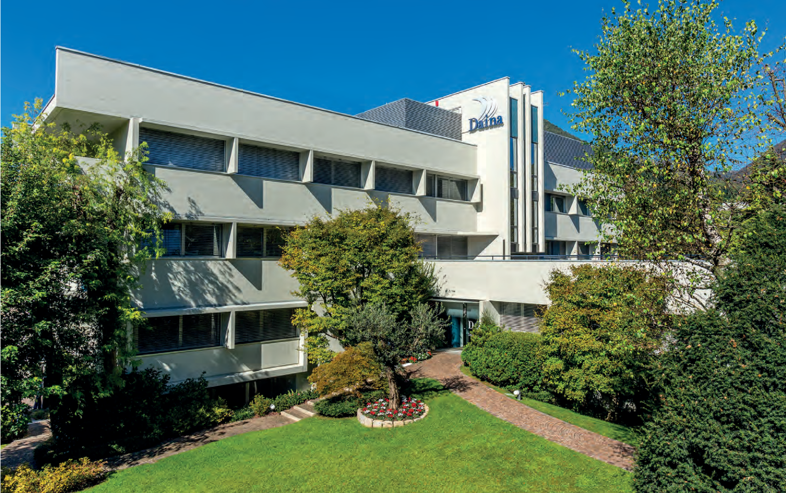
Centro Daina a Nembro (Bg); al suo interno sarà possibile visitare il parco educativo di Joe Brush.