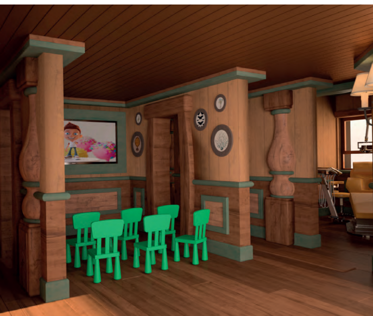
Sotto. Rendering di due aree interne del parco tematico dove i bambini potranno apprendere le prime nozioni sull'igiene dentale e imparare a lavarsi i denti.