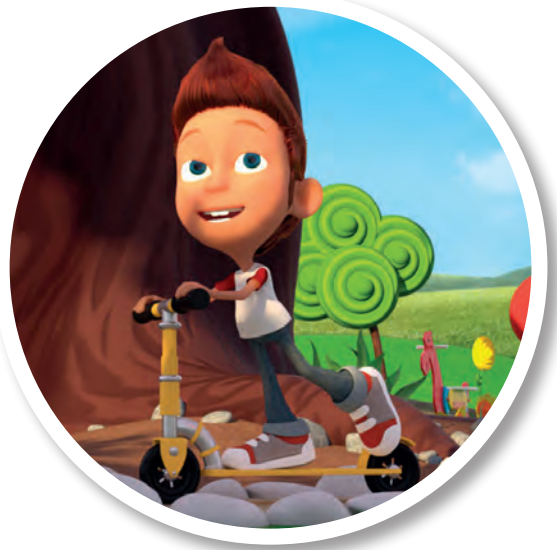
A fianco. Tommy a passeggio con il suo monopattino in una scena del cartone animato.