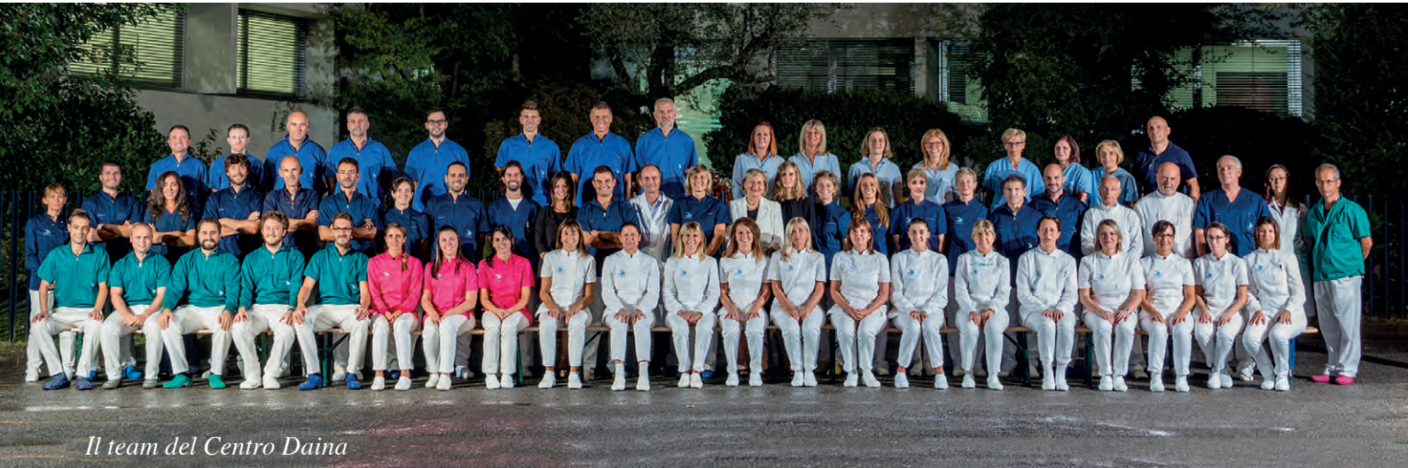
Il team del Centro Daina