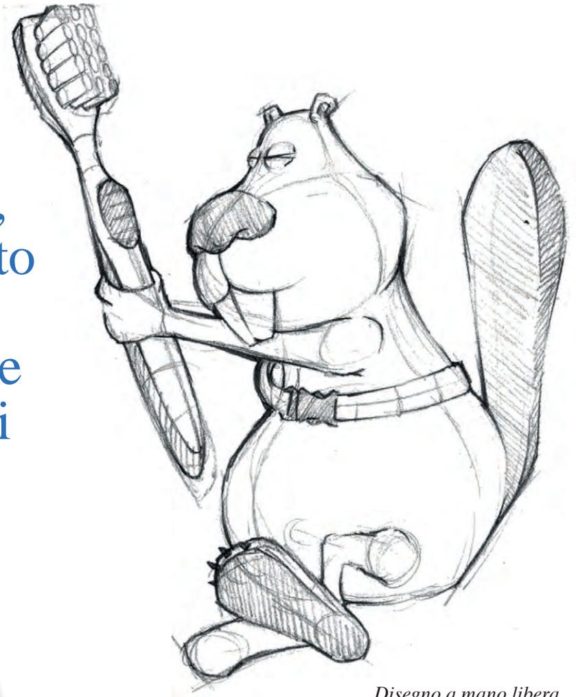
Disegno a mano libera nella fase ideativa di Joe Brush.

Un itinerario didattico pensato, progettato e ricreato per insegnare, ai più piccoli, a come prendersi cura dei loro denti.