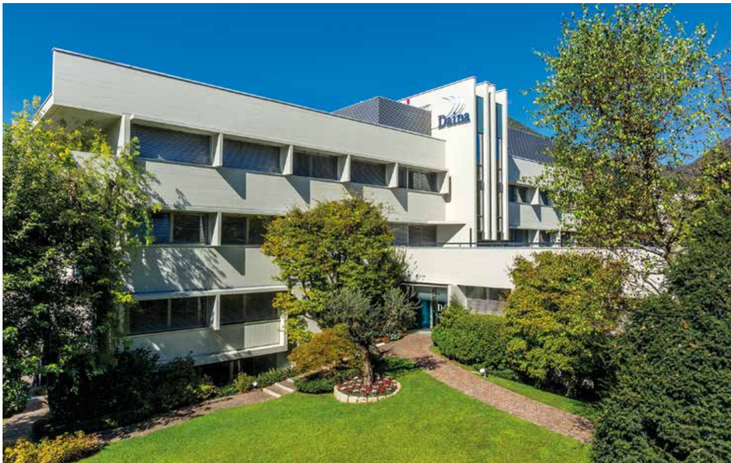
Centro Daina a Nembro (Bg); al suo interno sarà possibile visitare il parco educativo di Joe Brush.