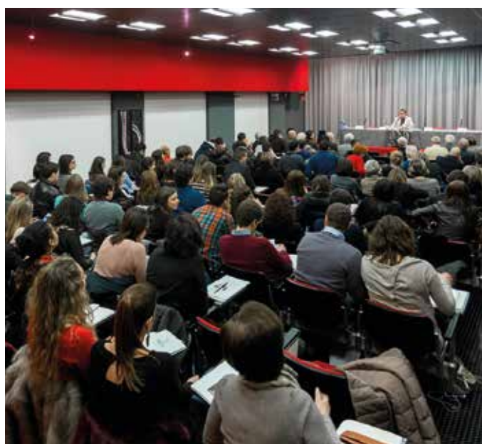
Auditorium del Centro Daina.

L'inaugurazione del Parco avverrà a ottobre con altre sorprese tutte da scoprire.