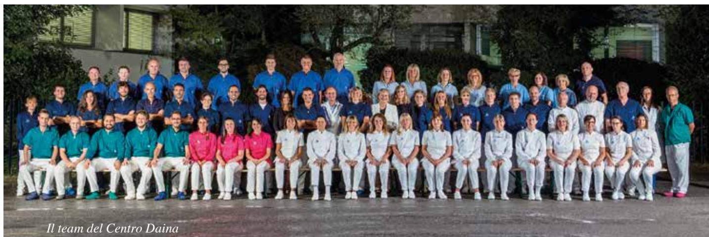
Il team del Centro Daina