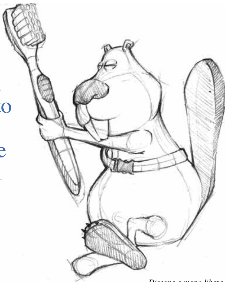
Disegno a mano libera nella fase ideativa di Joe Brush.

Un itinerario didattico pensato, progettato e ricreato per insegnare, ai più piccoli, a come prendersi cura dei loro denti.