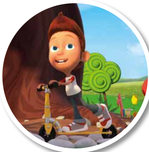
A fianco. Tommy a passeggio con il suo monopattino in una scena del cartone animato.