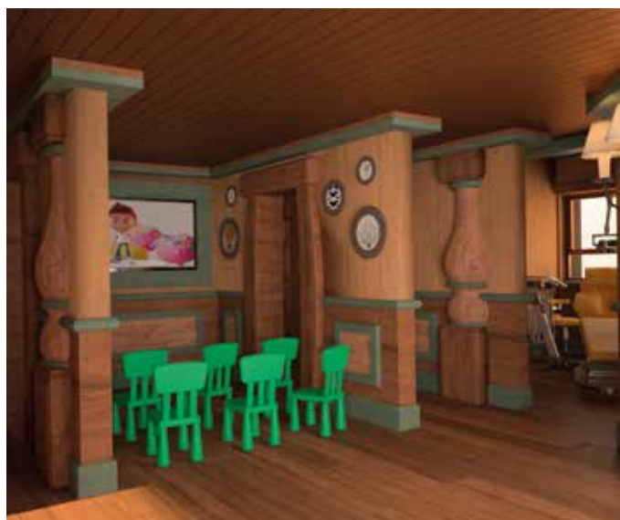
Sotto. Rendering di due aree interne del parco tematico dove i bambini potranno apprendere le prime nozioni sull'igiene dentale e imparare a lavarsi i denti.