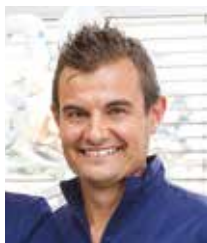
a cura del Dott. Stefano Daina Odontoiatra specialista in chirurgia odontostomatologica

C apita spesso, durante le pause estive che improvvisamente scaturisca il mal di denti. Il caldo, infatti, esaspera le infiammazioni e aumenta la vasodilatazione sanguigna.